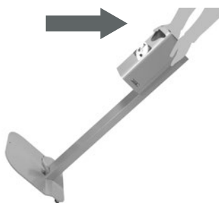
Movible (con ruedas)